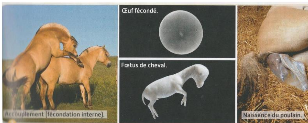
Doc. 2 : Le cycle de vie du cheval.